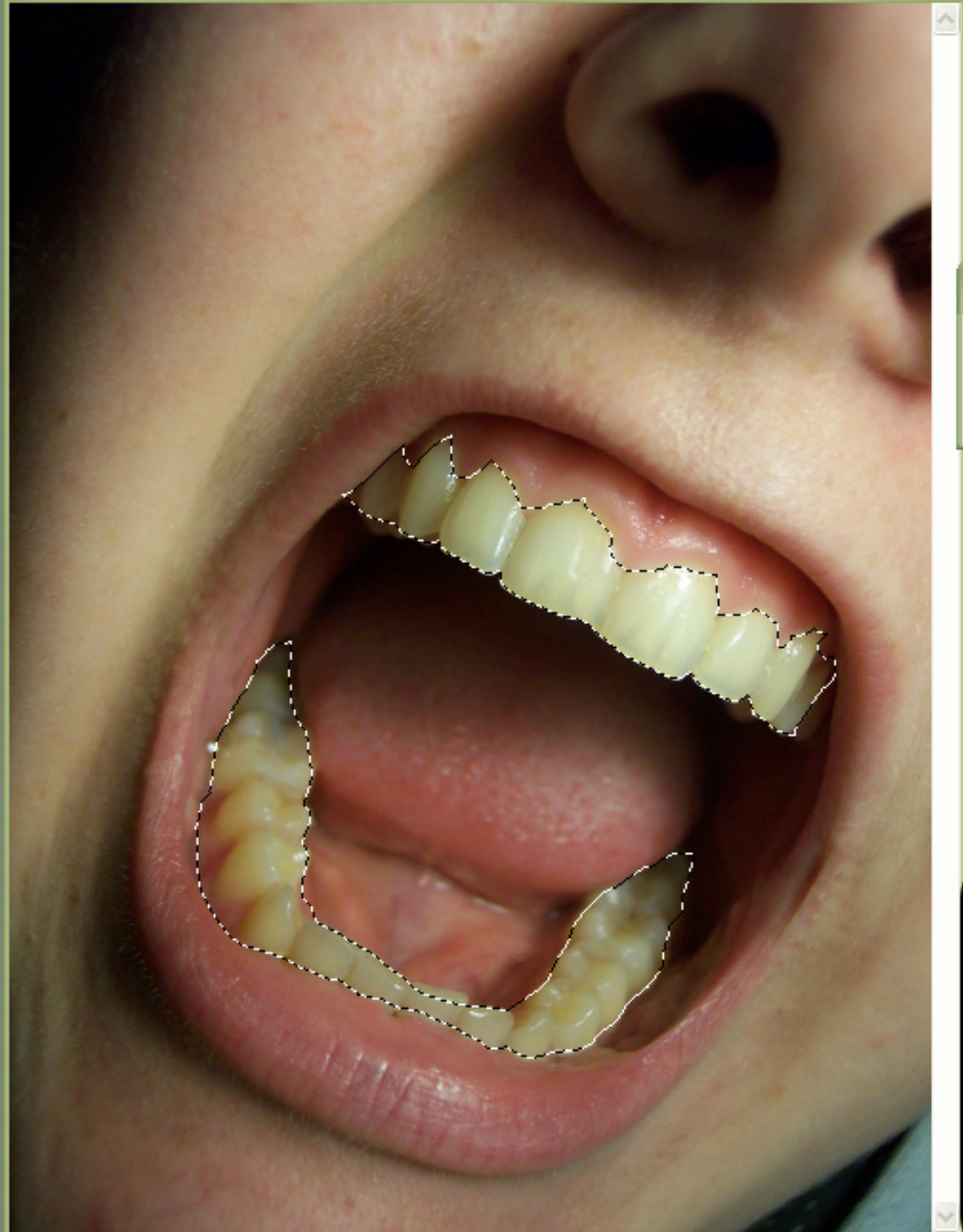
teeth_by_oyam.jpg @ 50% (RGB/8#)